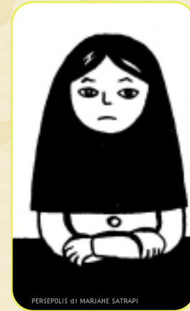
PERSEPOLIS di MARIJANE SATRAPI

Dalla finestra case e canali parlavano di Europa del nord. Gli odori di casa erano invece i profumi del mondo. Metà del quale quel giorno era a digiuno. Giorno di Ramadan, niente cibo dall'alba al tramonto. E io lì, tanti anni fa, giovane ospite di digiunanti algerini, indeciso se attendere la sera o uscire alla ricerca di burro ed aringhe. Entravano prima dell'alba nel pentolone di coccio gli ingredienti della zuppa del Ramadan, quella che alcuni chiamano harira, quella che è sempre la stessa tutte le sere. Bene, nel pentolone di coccio destinato a sfamare un piccolo esercito di digiunanti, finivano lenticchie, cipolle, carne di agnello macellato come dispone il Corano dal macellaio islamico dietro l'angolo, ceci, tantissimi ceci, carote, pomodori, prezzemolo e poi spaghetti... Sì, spaghetti - c'è un italiano, perdinci! - e via i Barilla fatti a pezzi e lasciati bollire.